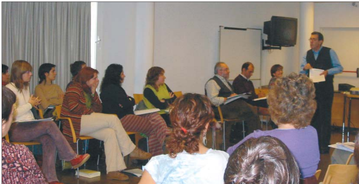
Jornades de formació. El passats 17 i 24 de novembre la Fundació va organitzar unes jornades d'Aprentatge-Servei en las que hi van participar més de 50 responsables de l'entitat.

Però quan un grup de nois i noies pren la decisió de netejar l'indret i a partir d'aquí aprèn a organitzar-se de la millor manera per dur-ho a terme; analitza i interpreta les deixalles que recull; pren consciència del risc de destrucció de la natura i a més a més, "s'embruta les mans" netejant la font, contribuint d'aquesta manera a millorar l'entorn... llavors el que està fent