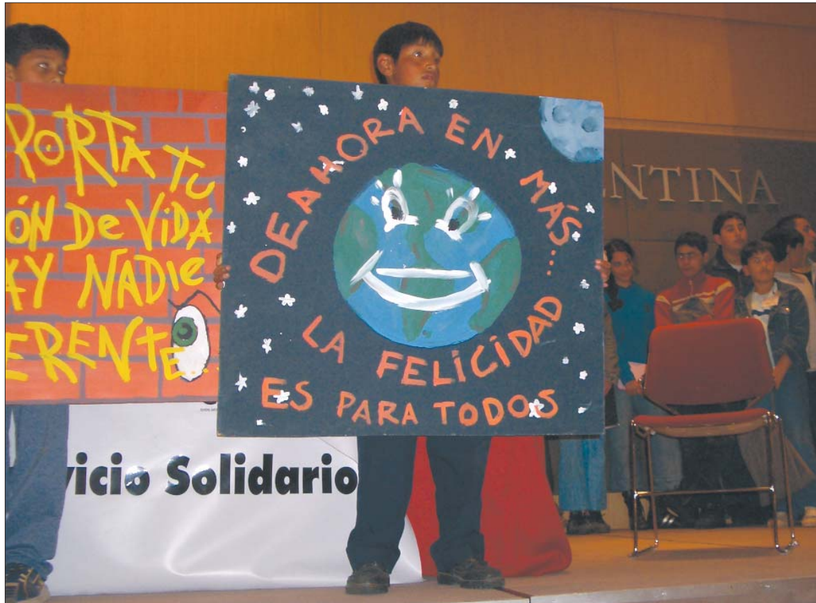
Adolescents explicant els seus projectes en el Seminari Internacional celebrat a Buenos Aires

El Ministeri de Educació, Ciència i Tecnologia d'aquest país ha estructurat el Programa Nacional de Educació Solidària per fomentar aquesta pràctica. Entre d'altres dispositius, atorga, cada any, un premi presidencial al conjunt d'escoles que han destacat per la qualitat i innovació dels seus projectes. A més a més, organitza un seminari internacional a l'octubre que ja porta vuit edicions, i