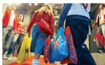
Los españoles de 16 a 29 años reconocen que les gusta gastar dinero y dar sus caprichos

Així mateix, destaquen que en sèries com Los Serrano els protagonistes superen l'edat que corresponria als adolescents que encarnen i, per exemple, sempre estan estudiant segon de batxillerat. A més a més, se centren exclusivament en els nois de la ciutat i no en els seus hàbits d'evolució.